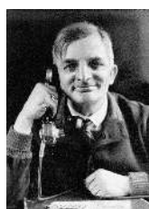
Joachim Ringelnatz (1883-1934)

Schenke mit Geist ohne List. Sei eingedenk, dass dein Geschenk – Du selber bist.